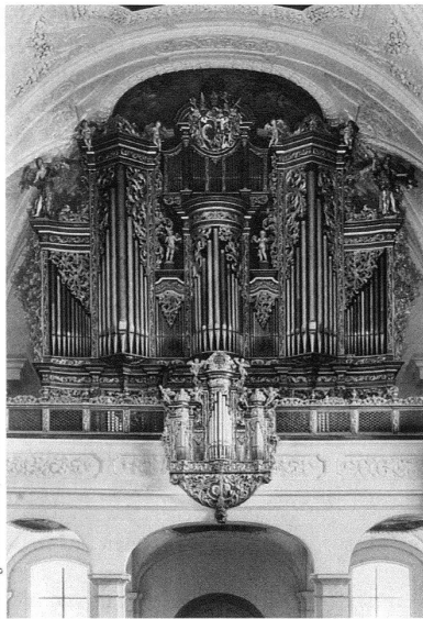
Rheinau, ehemalige Klosterkirche, Hauptorgel, Gesamtansicht nach der Restaurierung 1988–1990.