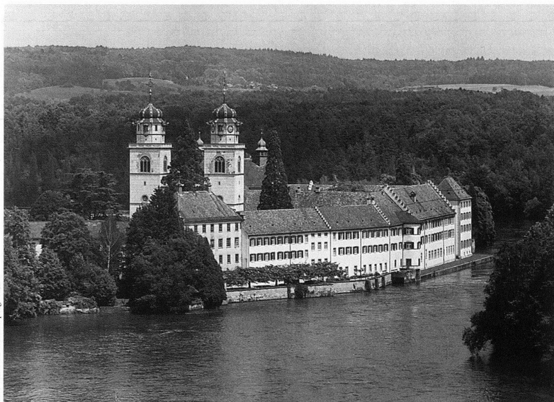
Rheinau, Klosterinsel, Ansicht der ehemaligen Klosteranlage und Umgebung von Südwesten, Aufnahme 1987.

Der Anfang der nun abgeschlossenen Gesamtrestaurierung, welcher der zweite Hauptteil des Buches gewidmet ist, fiel in die Zeit des Europäischen Jahres für Denkmalpflege und Heimatschutz 1975 – Rheinau wurde als Musterbeispiel in das kantonale Programm aufgenommen – und der Gründung des Instituts für Denkmalpflege an der ETH Zürich 1972, dessen erster Leiter Albert Knoepfli in Rheinau als eidgenössischer Experte waltete. So wurde eine naturwissenschaftliche Begleitung der Turm- und Fassadenrestaurierung durch das Labor des Instituts möglich, die von dessen Leiter Andreas Arnold geschildert wird. Spannend ist der Vergleich der Zustandsbeschreibungen der Steine an den Westtürmen aus den unterschiedlichen Blickwinkeln des Naturwissenschaftlers und der Statiker (Peter Ehmann und Rolf Johann), welcher letzteren es verziehen sei, dass sie hydraulischen Kalk mit Sumpfkalk gleichsetzen! (S. 262) Heinz Schwarz und Annette Meier-Schendekehl berichten über die vorbildlichen und minutiösen Untersuchungen des Aussenputzes und der äusseren Farbigkeit und belegen die Interpretationsbedürftigkeit von Befunden im Hinblick auf Neufassungen. Im Gegensatz zum Äusseren war die innere Raumschale weder restauratorisch noch naturwissenschaftlich untersucht worden, da man sie ursprünglich nur reinigen wollte. Man überholte sie