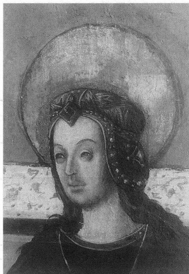
Tafelfragment mit einer Heiligen aus Schmitzen, Disentis, Klostersammlungen.

Der Ostschweizer Kanton Graubünden ist im Vergleich mit anderen Kantonen noch heute ungemein reich mit spätgotischen Retabeln und mit Flügelaltären des 16. Jahrhunderts ausgestattet. Zahlreiche Werke befinden sich noch in den Kirchen, andere kamen nach Aufhebung von Klöstern und bei Veräusserung durch die Gemeinde an Museen bzw. – meist nur als Teile eines ehemaligen Zusammenhanges – über den Kunsthandel an neue Besitzer und fanden somit ein geschütztes Zuhause. Sicher gehört die seinerzeit nicht in allen Landesteilen angenommene Reformation zu einem der Hauptgründe für diesen Umstand. Somit konnten zahlreiche Bestände ihren Bestimmungsorten erhalten bleiben. Andererseits kamen auch die obsolet gewordenen Retabel aus evangelisch gewordenen Gemeinden an altgläubig verbliebene. Ein