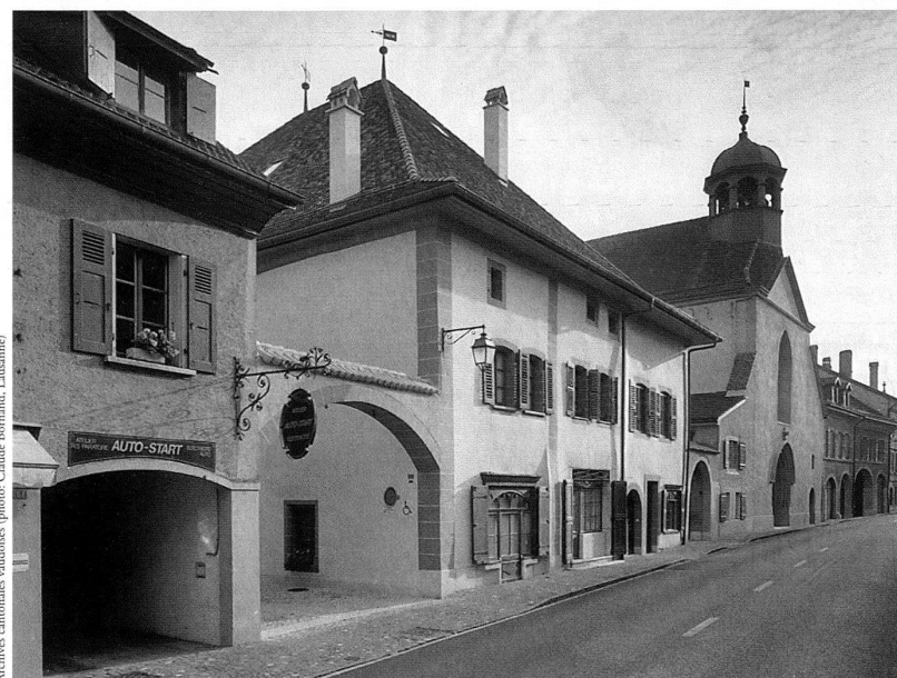
Coppet, l'ancienne «maison du couvent» et la façade de l'église des Dominicains, devenue le temple, datant de la fin du XV e siècle et de 1723 pour sa partie supérieure.

Ainsi, cette œuvre collective et de longue haleine, commanditée par la commune de