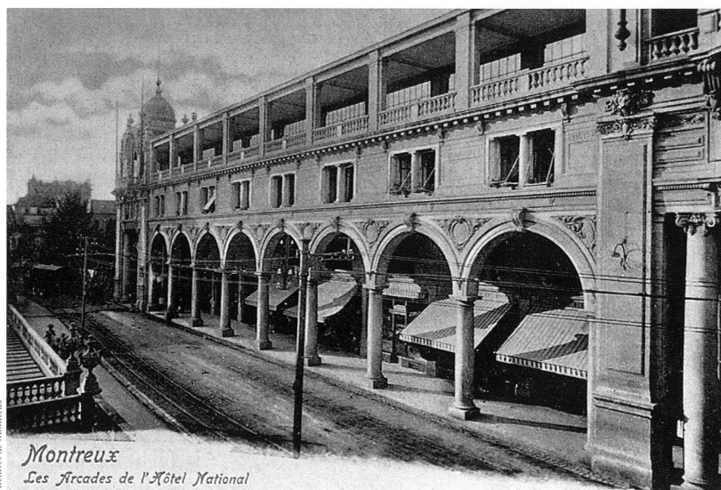
1 La galerie de l'Hôtel National à Montreux (1895–1896), dont la typologie est unique dans la région.