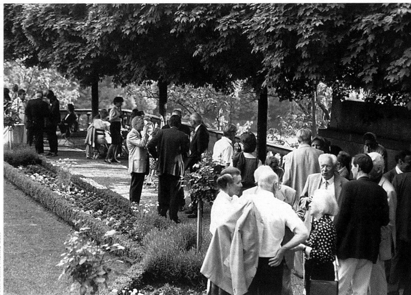
Generalversammlung 1999 in Bern. Bei strahlendem Wetter geniessen die anwesenden Mitglieder und Gäste den von der Stadt Bern offerierten Aperitif im Erlacherhof.