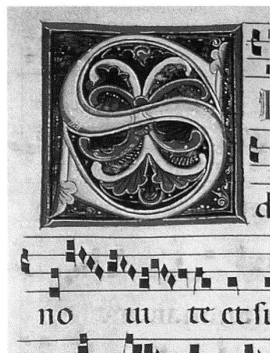
2 «Miniatore dei trafori metallici», S(imon petre) , secondo decennio del 1300, tempera su pergamena ( Antifonario in festivitibus sanctorum , c. 23r.), 86x86mm, Biblioteca del Convento della Madonna del Sasso, Orselina. — All'interno di una cornice realistica si trova l'iniziale riccamente decorata con motivi vegetali.

Il rosso, fondamentale per il «Miniatore calligrafo» (ill. 4), come per il rubricatore, venne adottato in particolare dal «Miniatore delle scenette sacre» (ill. 3, 5-6) per ottenere un forte contrasto con il blu e il grigio. Si tratta del cinabro, conosciuto dagli antichi come «minio» e impiegato principalmente nelle rubriche e iniziali semplici. È solfuro rosso di mer-