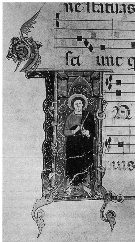
3 «Miniatore delle scenette sacre», I(n medio) , 1316 circa, tempera su pergamena ( Graduale , c. 20v.). — Iniziale abitata con San Giovanni Evangelista (27 dicembre). In questa immagine del 1958 è ancora visibile l'iniziale miniata, in seguito ritagliata e dispersa.