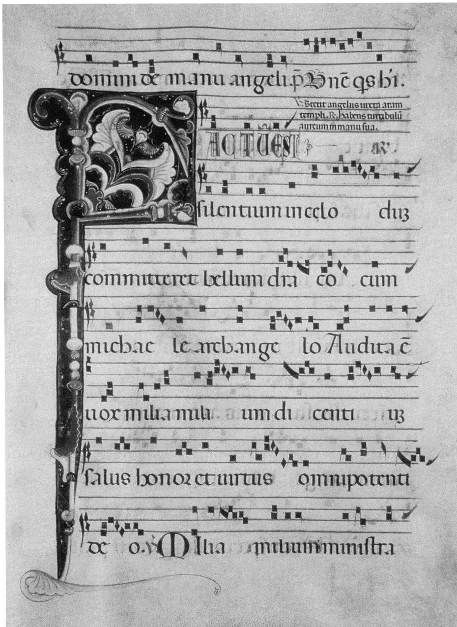
1 «Miniature dei trafori metallici», F(actu[m] est), secondo decennio del 1300, tempera su pergamena (Antifonario in festiuitatibus sanctorum, c. 65r.), 350x100mm, Biblioteca del Convento della Madonna del Sasso, Orselina. – Iniziale realizzata con il motivo del fregio a barra all'interno di un bordo mistilineo nero. Questa immagine offre un esempio dell'organizzazione di una pagina: le otto unità tetragramma-riga di testo, il margine inferiore pronunciato e l'iniziale semplice M (ultima riga, in basso) non completata da filigrana.

La rigatura, tracciata in modo elegante nel Graduale con un inchiostro bruno molto diluito, è realizzata negli altri tre manoscritti a mina di piombo che ha lasciato delle tracce di colore grigio.