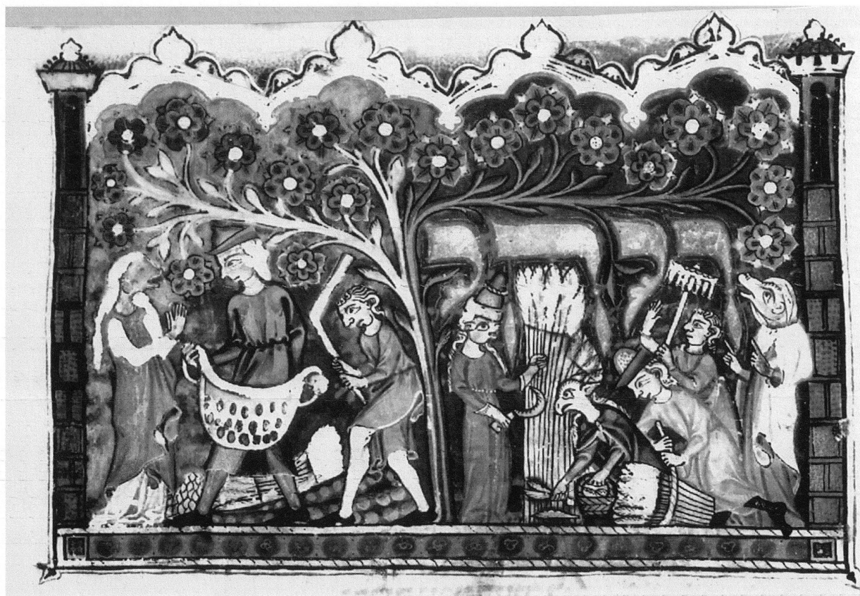
9 Szene aus dem Buch Ruth, Miniatur aus dem 3-bändigen Machsor , London, British Library, Ms. Add. 22413, fol. 71r. – Stilistisch und ikonographisch zeigen sich Beziehungen zu christlichen Handschriften: Die Gesichter im Profil sind denjenigen aus dem Graduale ähnlich (vgl. Abb. 2), die Figur der Schnitterin scheint aus der Manessischen Liederhandschrift übernommen zu sein (vgl. Abb. 10).

Die lokale Eigenart des jüdischen Machsor zeigt sich in der Adaption von Motiven profaner Herkunft ebenfalls, beispielsweise in der Miniatur des Buches Ruth (Abb. 9). Unter den Figuren dieser Illustration ragt eine Schnitterin hervor, die höchstwahrscheinlich Ruth selbst darstellt. Nach einem Midrasch, der in den Jüdischen Altertümern des Josefus Flavius erscheint, befiehlt Boas Ruth, die gerade auf seinem Feld Nachlese vollzieht, zu ernten, statt nur nachzulesen (5. Buch 9,12). Die hier dargestellte Schnitterin trägt auffallend aristokratische Handschuhe, die in krassem Gegensatz zur Feldarbeit stehen, die sie ausübt. Eine ähnlich «aristokratische» Schnitterin findet sich in der Manessischen Liederhandschrift, die in mehreren Etappen zwischen 1300 und 1340 in Zürich geschaffen wurde (Abb. 10). 29 Die Schnitterin in der Liederhandschrift trägt, ähnlich wie die im Machsor , ein langes, rotes Gewand, ihr Haar quillt unter dem Hut hervor, und lange Handschuhe bedecken ihre Hände und Handgelenke. In ihrer linken Hand hält sie ein Ährenbüschel, in der rechten eine Sichel. In der Liederhandschrift ist sie keine Feldarbeiterin, sondern die Geliebte eines Ritters, die in dem mit dieser Miniatur geschmückten Lied erwähnt wird.