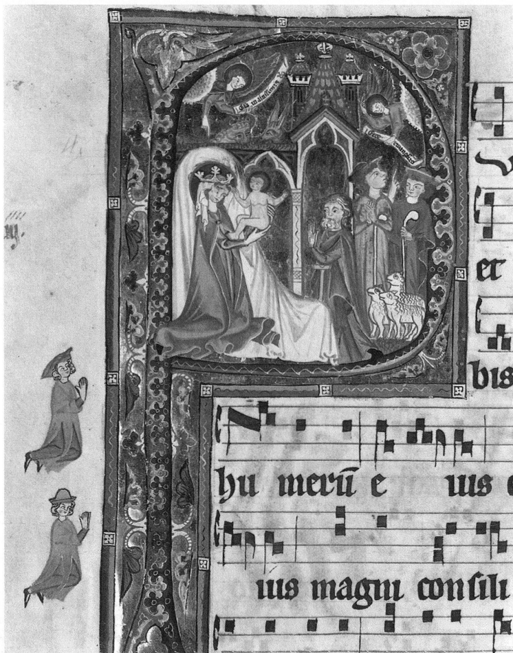
2 Anbetung der Hirten, Initiale P ( uer natus est ) aus dem Graduale von St. Katharinenthal, Bodenseeraum, um 1312, Zürich, Schweizerisches Landesmuseum, Inv. Nr. 26117, fol. 18v. – Stilistisch sind die narrativen Szenen aus dem Machsor eng mit den Miniaturen aus dem Graduale verwandt.