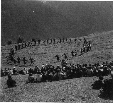
Schweiz: Gesellschaft für Volkskunde, Basel, DL 89