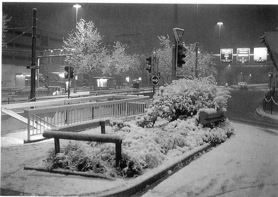
12 Peter Fischli/David Weiss, «Siedlungen, Agglomeration», 1993, Forobuch. – Die letzte Abbildung im Buch repräsentiert noch einmal den Winter bei weihnachtlicher Stimmung am Abend.