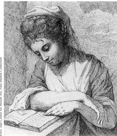
Angelika Kauffmann, Mit Zeigefinger Lesende , Radierung, 1770, 27,7 × 24,2 cm (Blatt), Yale Center for British Art, Paul Mellon Collection.