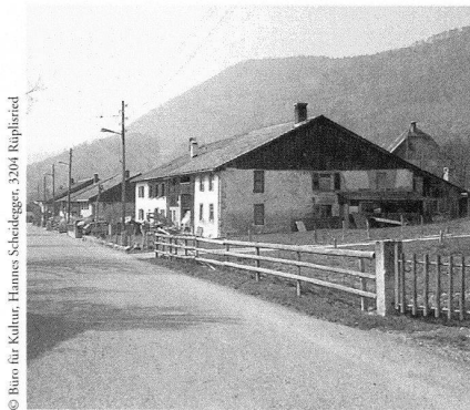
Das Dorf Soulce JU hat einen einzigartigen Bestand an landwirtschaftlichen Bauten aus dem 18. Jahrhundert. Zusammen mit der Sanierung der Mühle und des Kanalsystems bildet die Erhaltung der ursprünglichen Bausubstanz den Kern des von Pro Patria unterstützten Projekts.

Eigentümer war diese Lösung schlussendlich kostenneutral.