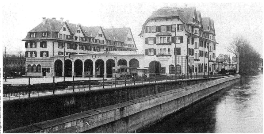
Das neue Tramdepot Hard in Zürich um 1911, Ansicht vom Fluss her.

Eine besondere Stellung nahm die Sanierung der Depothalle ein. Einzelne statisch geschwächte Unterzüge der Voutenhalle wurden gezielt mit Laschen verstärkt. Die ausgeschwemmten Deckenfelder wurden einer Betonsanierung (Auftrag eines Spritzbetons) unterzogen, wobei durch einzelne Brettabdrucke und einen lasierenden mineralischen Anstrich der Charakter des Ortbetons wieder zur Geltung gebracht