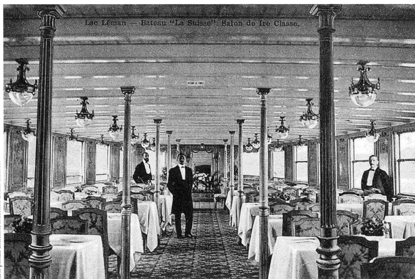
Le grand salon néo-Louis XVI de «La Suisse», le plus spacieux de la flotte avec ses 120 couverts, combinant marqueteries et bois sculptés, œuvre de la maison Bobaing Frères à Lausanne. Etat d'origine.

Carte postale ancienne; collection Didier Zuchuat