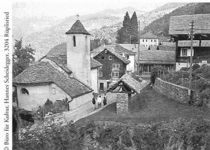
Tengia TI liegt an der Strada Alta zwischen Airolo und Biasca. Pro Patria hat die Restaurierung des Dorfbrunnens und die fachgerechte Sanierung der Natursteinpflasterung im Rahmen der Kampagne «Ortsbilder 2000» unterstützt.

Das Tramdepot an der Hardturmstrasse war das Erste, das im Heimatstil erbaut wurde – alle neun früheren Depots waren in historistischer Sichtbackstein-Bauweise errichtet worden. Bis heute haben sich auf dem jetzigen Stadtgebiet von den ursprünglich zwölf Trambahn-Depots aus der