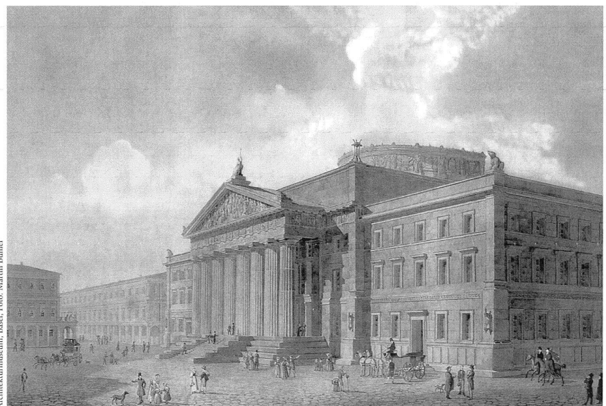
Architekturmuseum, Basel; Foto: Martin Bühler

Die Ausstellung und die begleitende Monografie möchten dazu beitragen, die Bedeutung des Baumeisters Berri hervor zu heben, der den Vergleich mit dem damaligen europäischen Umfeld keineswegs zu scheuen braucht. Originale Pläne und Studien Berri bilden den Kern der Ausstellung, ergänzt mit heutigen Arbeiten des Fotografen Serge Hasenböhler. pd/RB