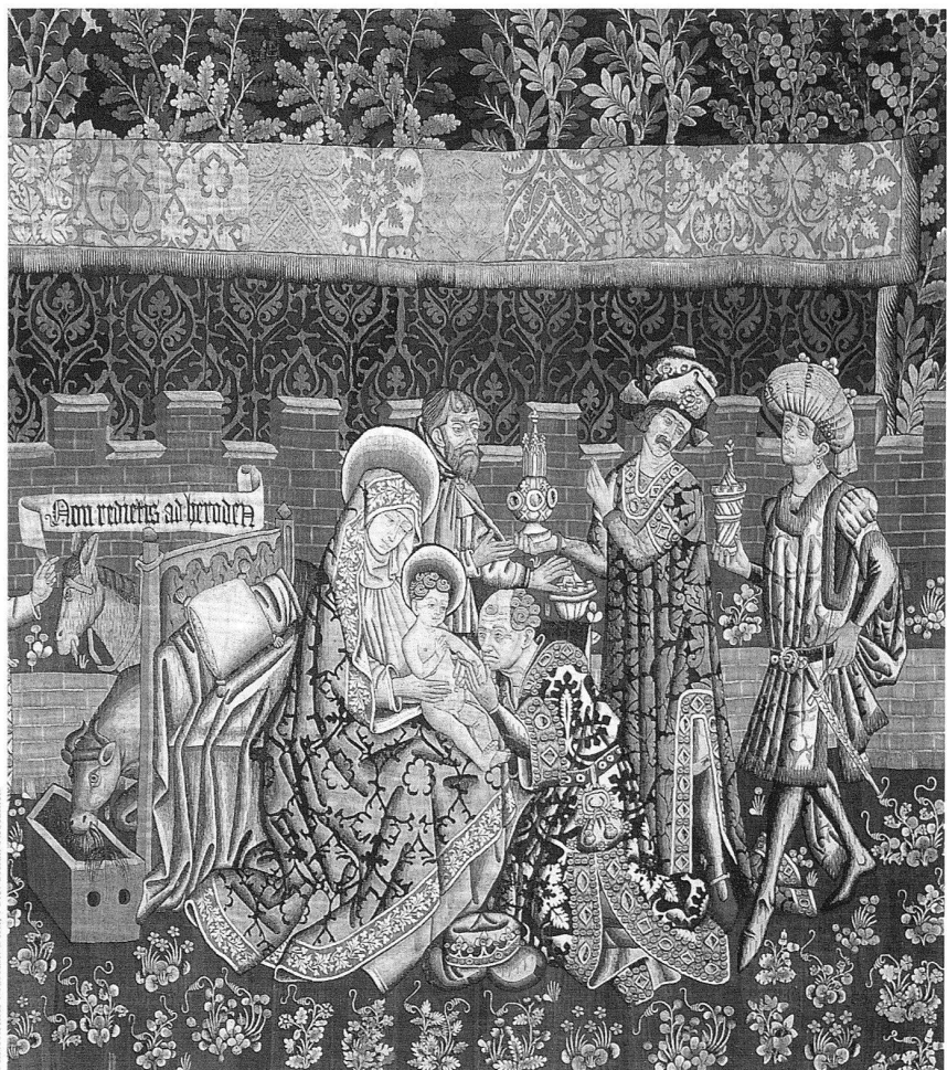
Historisches Museum Bern; Foto: Stefan Beckmann