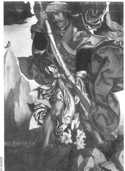
Hans Fries, Hl. Christophorus , 1503, ölhaltiges Bindemittel auf Holz, 98 × 68 cm, Museum für Kunst und Geschichte Freiburg.

Hans Fries (geboren um 1460/65 in Freiburg i. Ü., gestorben nach 1523) ist der wohl interessanteste Schweizer Maler aus der Zeit um 1500. Von ihm ist ein schmales, jedoch hochkarätiges Werk überliefert, darunter 35 originale Gemälde. Fries stellte ausschliesslich religiöse Themen dar. Er lebte an der Wende vom Mittelalter zur Neuzeit, kurz bevor die Reformationswirren den Umgang mit der Religion und damit auch die Aufgaben der Künstler grundlegend änderten. Neben den Einflüssen der Schweizer «Nelkenmeister» und vermutlich der Basler Malerei scheinen ihn gegen Ende seines Lebens auch Gemälde von Niklaus Manuel Deutsch berührt zu haben. Massgebliche Anregungen empfing er zudem aus der Druckgrafik, allem voran aus Dürers Holzschnitten, über die er zum Teil schon kurz nach ihrer Entstehung verfügt haben muss. Trotz den Einflüssen blieb Fries jedoch in erster Linie ein eigenwilliger Künstler von grosser bildschöpferischer Kraft. Oft setzte er selbstbewusst seinen Namen unter die vollendeten Werke – dies zu einer Zeit, als die meisten Maler ihre Arbeit noch nicht signierten. Er beobachtete nicht nur akribisch genau seine Umgebung, um sie mit magisch anmutender Naturnähe wiederzugeben, sondern erfand seine eigene Formenwelt, indem er Landschaften und Gewanddraperien usw. zu beinahe abstrakten Gebilden stilisierte. In seinen Gemälden verbindet sich spätgotisches Formemp-