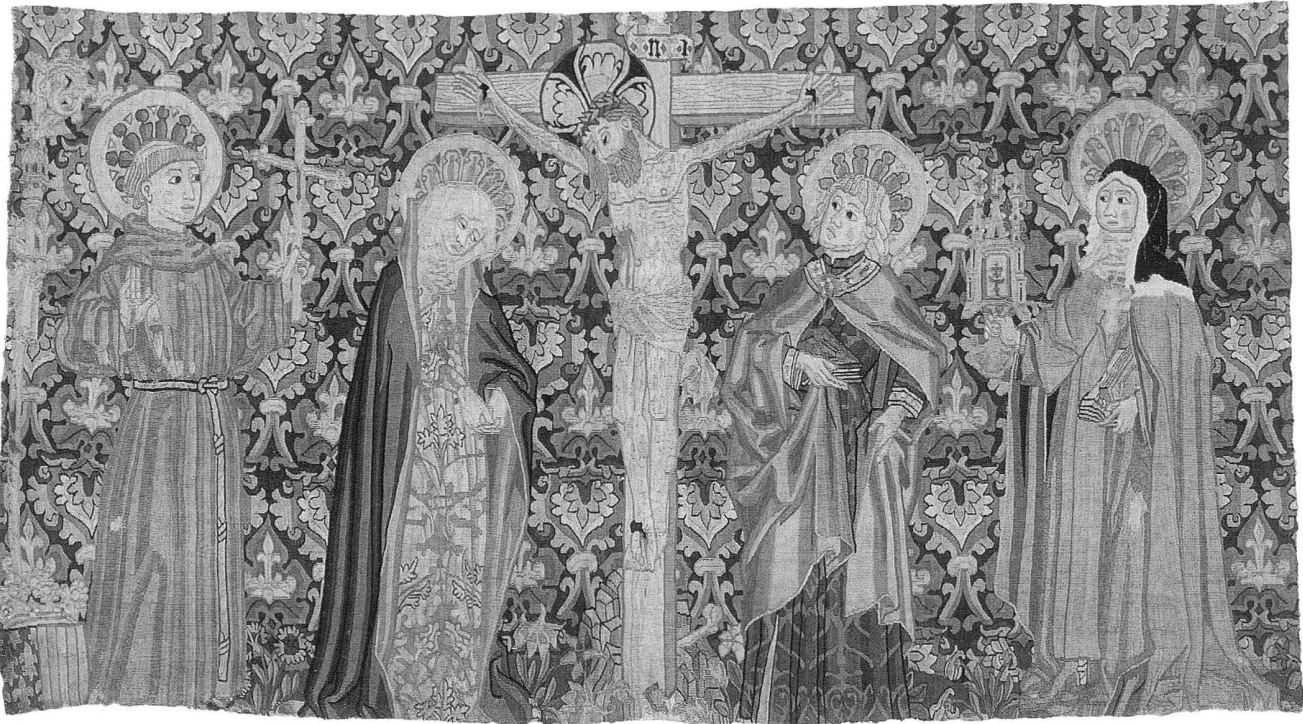
1 Kreuzigungsteppich, um 1480, Basler Wirkerei, 94 × 170 cm, Historisches Museum Basel. – Der erst kürzlich erworbene Teppich zeigt die Kreuzigung Christi mit Franziskanerheiligen.

Hinter der dunkel anmutenden Überschrift verbirgt sich die im alemannischen Sprachraum des Spätmittelalters geläufige Bezeichnung für gewirkte Antependien. Im Begriff «Heidnischwerk» und «heidnisches Werk» widerspiegelt sich die antike Herkunft der Wirktechnik. 1 Anhand eines um 1480 entstandenen Wirkteppichs (Abb. 1), 2 der 1999 für das Historische Museum Basel erworben werden konnte, soll ein Einblick in die Blütezeit der Basler Bildwirkerei der Spätgotik gegeben werden.