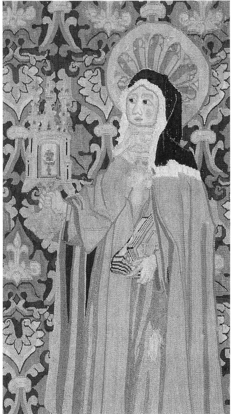
2 Kreuzigungsteppich (Detail): hl. Clara, Basel, um 1480. – Die hl. Clara ist an ihrer Tracht und ihren Attributen, der Monstranz und dem Buch mit Lilie, erkennbar. Sie ist die Begründerin des weiblichen Zweiges des Franziskanerordens.

trägt und dessen Seitenwunde gross und stark blutend ist, wird betont. Neben Maria, deren Kopf in Trauer gesenkt ist, steht der hl. Franziskus von Assisi, gekennzeichnet durch die graubraune Kutte der Franziskaner mit dem Knotenstrick, das Kreuz und die Wundmale; neben Johannes steht die hl. Clara, ebenfalls erkennbar an ihrer Tracht und ihren Attributen, der Monstranz und dem Buch mit der Lilie in den Händen (Abb. 2). Am linken Bildrand schliesst der Rest einer weiteren Figur an: ein Bischofsstab, von einer Hand gehalten, und am Boden ein bekröntes Wappen