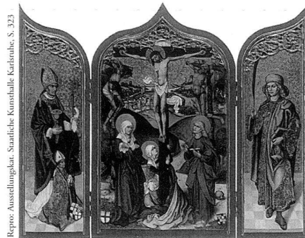
Michael Haider, Triptychon, um 1500 gestiftet von Hugo von Hohenlandenberg, Tempera und Öl auf Tannenholz, Mitteltafel 192 x 212 cm, Staatliche Kunsthalle Karlsruhe.