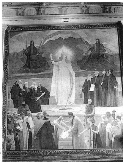
Photographie de Faucher