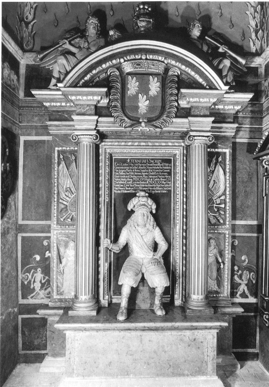
8 Memorialkapelle für Albrecht von Wattenwyl, nach 1671, Stuckmarmor, Kirche Oberdiessbach. – Eine ganze Kapelle soll mit einer Plastik, Emblemen und Inschriften an die Verdienste eines wohlwollenden Erbonkels erinnern.

Für die sehr stark im politischen Denken verhafteten Berner des 17. und 18. Jahrhunderts hatten die Künste nur ihre Berechtigung, wenn sie ausdrücklich der obrigkeitlichen und privaten Selbstdarstellung dienen konnten. Sogar die private Selbstdar-