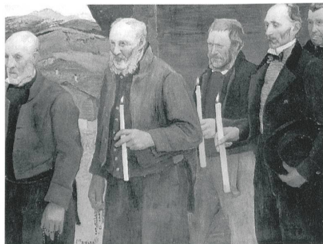
Ernest Biéler, Les Vieux à l'enterrement, 1901, Öl auf Leinwand, Privatbesitz. (Repro, Ausst.kat. Ernest Biéler, Lausanne 1999)