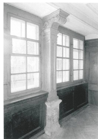
Zürich, Neustadtgasse 7a, Fenstersäule im Erdgeschoss. (Baugeschichtliches Archiv der Stadt Zürich)

Für die Errichtung der beiden kunstvollen Fenstersäulen waren zwei wohlhabende Herren von hohem sozialem Stand verantwortlich: Diethelm Röst (1482–1544), ehemaliger Bürgermeister von Zürich, gab die Fensterstütze von 1534 in Auftrag, Junker Johann Escher vom Luchs (1540–1628) veranlasste im Jahr 1574 den Einbau der anderen Säule. Untersuchungen zur Hausgeschichte der betreffenden Bauten zeigten, dass es im 16. Jahrhundert gewöhnlich Personen mit gehobenem sozialem Status waren, welche die Anbringung von Fenstersäulen anordneten. Es handelte sich dabei häufig um Inhaber von städtischen Ämtern, Kaufleute und Zunftmeister sowie gelegentlich Handwerker.