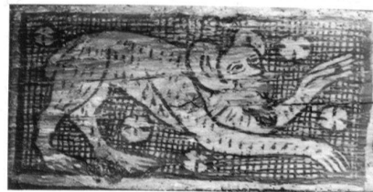
Basel, Schönes Haus, Erdgeschoss, Balkenmalereien, Ausschnitt: Wilschwein. (Sabine Sommerer, 2001)