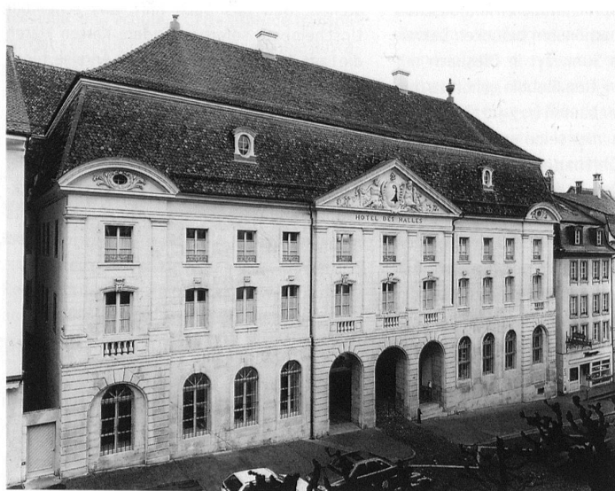
Porrentruy, Hôtel des Halles par Pierre-François Paris, 1766–1769, façade principale. (République et Canton du Jura, Office du patrimoine historique, Porrentruy; photo: Jacques Bêlat)

Les années 1750–1760 témoignent d'un encouragement éclairé aux arts, issu de la philosophie des Lumières. En étroite contact avec le royaume de France, la cour de Porrentruy entre naturellement dans la sphère culturelle française, bien que toujours rattachée au Saint-Empire. De plus, on y dénote un vif désir de luxe et d'apparat en une période de grande prospérité économique. Cependant, le faste de Porren-