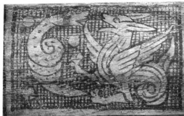
Basel, Schönes Haus, Erdgeschoss, Balkenmalereien, Ausschnitt: Panotier. (Sabine Sommerer, 2001)