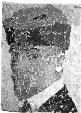
Augusto Giacometti, Selbstbildnis, 1910, Bündner Kunstmuseum Chur.

bis 14. September 2003, Di–So 10–17 Uhr, Do 10–20 Uhr. Bündner Kunstmuseum, Postplatz, 7002 Chur 2, Tel. 081 257 28 68, www.buendner-kunstmuseum.ch