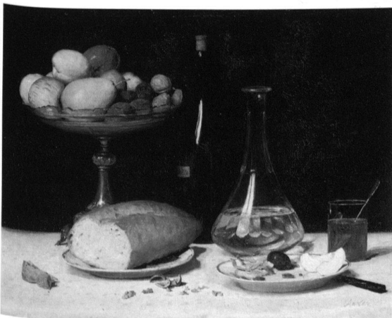
Albert Anker, Stillleben: Mässigkeit, 1896, Sammlung Christoph Blocher, Herrliberg.

jusqu'au 31 août 2003, ouvert de 10 à 17 heures, fermé le lundi. Musée d'art et d'histoire, 2, rue Charles-Galland, 1211 Genève 3, tél. 022 418 26 00, http://mah.ville-ge.ch