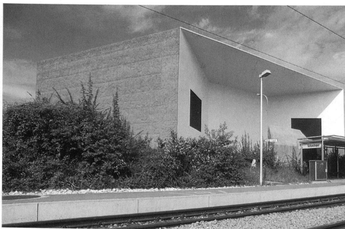
Das Schaulager in Münchenstein/Basel von Herzog & de Meuron.

Um 1910 widmete sich Giacometti in Florenz Landschaften, Blumenbildern und Bildnissen. Beeinflusst durch den Neo-Impressionismus trug er die unvermischten Farben wie Mosaiksteine in pastosen Flecken mit dem Spachtel auf. Bei einer Reihe bedeutender Gemälde fügten sich diese Farbflecken nicht mehr zu einem erkennbaren Gegenstand zusammen: Die leuchtenden Farben besetzen die ganze Bildfläche bis an die Ränder, verdichten sich oder lassen weite Teile der weiss grundierten Leinwand hell aufscheinen. Diese Kompositionen erscheinen wie ein willkürlicher Ausschnitt aus einem grossen kosmischen Ganzen. Mit diesen so genannten «chromatischen Phantasien» leistete Giacometti einen entscheidenden Beitrag zur frühen Moderne und zur Ungegenständlichkeit. Er vollzog