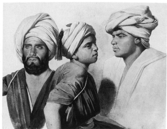
Charles Gleyre, Les Trois Fellah, 1835, Musée cantonal des beaux-arts, Lausanne.