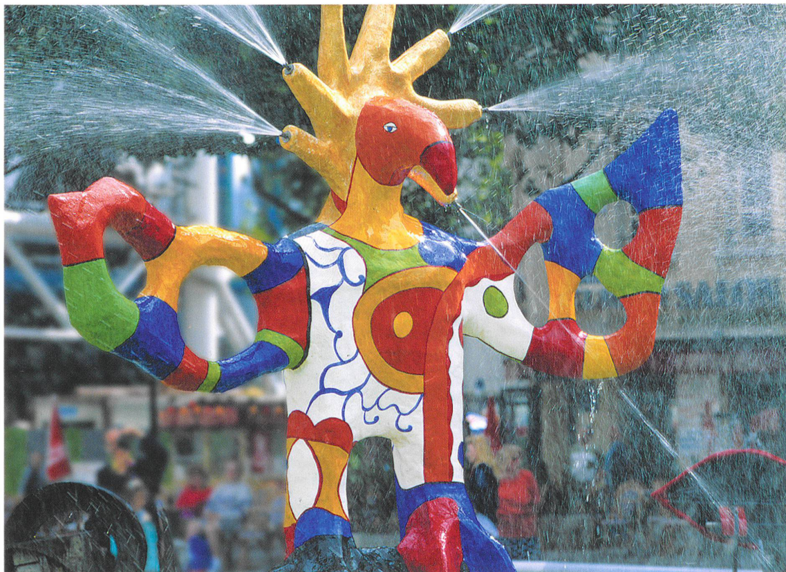
Stravinsky Brunnen von Jean Tinguely und Niki de Saint Phalle, Centre Pompidou, Paris

Ihr Partner für Vermögensverwaltung und Beratung