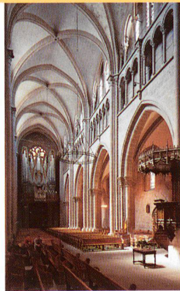
Gérard Deuber La cathédrale Saint-Pierre de Genève

En tant que membre de SHAS, nous vous offrons en exclusivité et à moitié prix un abonnement annuel d'essai aux Guides de monuments suisses.