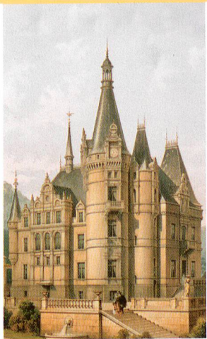
Hermann von Fischer Schloss Hünegg, Hilterfingen

Als GSK-Mitglied bieten wir Ihnen exklusiv ein Probe-Jahresabonnement der Schweizerischen Kunstführer GSK zum halben Preis an.