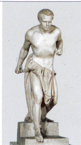
Marc-Joachim Wasmer Museo Vela in Ligornetto Das ehemalige Wohnatelier des Tessiner Bildhauers Vincenzo Vela