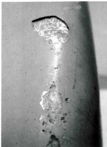
Schadensbild am Pantton-Chair.