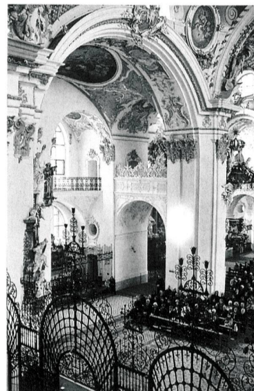
Die Jubiläumsfeier zum Erscheinen des 100. Kunstdenkmäler -Bandes in der Klosterkirche Einsiedeln.

Eine weitere Buchpräsentation fand Anfang November im Zunfthaus zur Meisen in Zürich statt. Dort konnte bereits der 102. Band, der dritte der Neuausgabe über die Stadt Zürich, aus der Taufe gehoben werden.