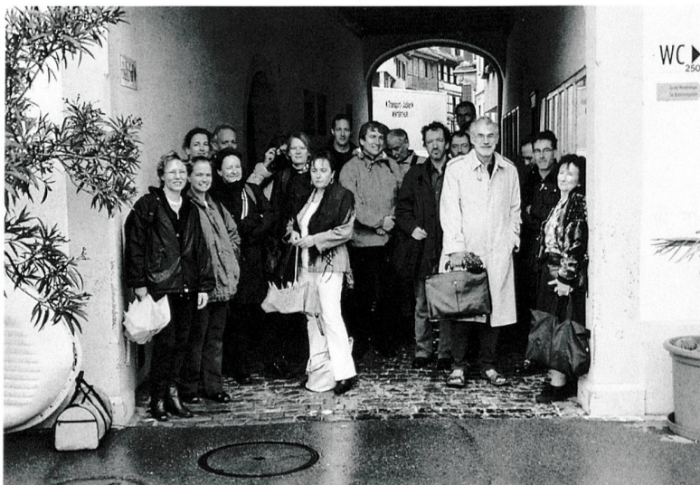
Tagung der Kunstdenkmäler-Autorinnen und -Autoren – ein Ausflug an den Untersee im Kanton Thurgau. (GSK)

La prossima assemblea generale si svolgerà il 5 giugno 2004 a Coira. Il programma è riportato nell'edizione 2004/1 di Arte + Architettura , distribuita lo scorso mese di febbraio. Saremmo pertanto lieti di ricevere ulteriori iscrizioni all'Assemblea.