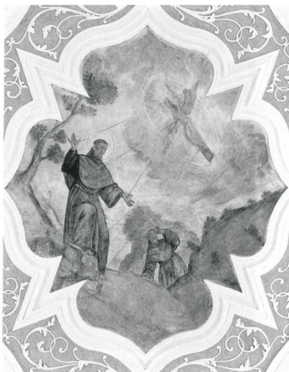
Paradies, Kloster- und Pfarrkirche St. Michael, Deckenmalerei, 1726.