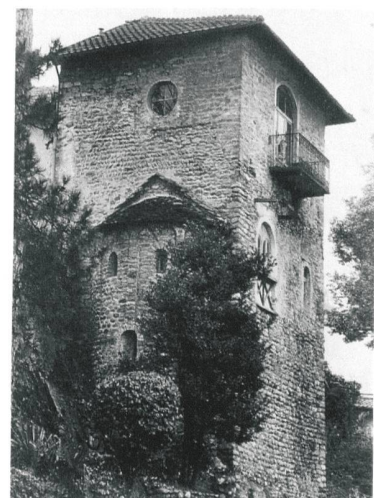
Ascona, castello san Materno. (Endrik Lerch, Ascona)