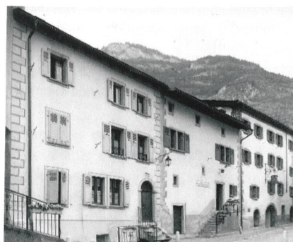
Saillon, maisons d'habitation. (Service des bâtiments, monuments et archéologie de l'Etat, Protection des biens culturels, Sion; Bernard Dubuis)

Ascona, Michela Zucconi-Poncini, 48 p., n. 744/745, CHF 10.– (ital., dt.). «Ascona terra d'artisti, di viandanti, di pescatori, di artigiani» si diceva una volta. In seguito, a partire dal Novecento, nasce il turismo di tipo esistenziale e meditativo inizialmente, alberghiero e residenziale poi. Il lago, le montagne, le isole di Brissago e le colline fanno da cornice al Borgo e al Lungolago, che