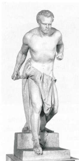
Vincenzo Vela, Spartaco, 1847–49, Museo Vela, Ligonetto. (Museo Vela)