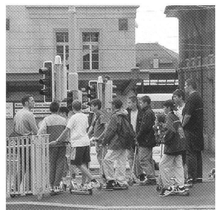
Exkursion mit dem Trottnett des Büros Tribu architecture. (© Tribu architecture)

Die Kurse für Schulkinder finden im allgemeinen in drei Teilen statt. Nach einer Einführung in das Bauen und die Arbeit der Architekten gibt es eine Diavortrag über die verschiedenen Häuserformen. Diesen Einführungskursen folgt immer ein praktischer Teil. Die Kinder basteln Häuser und setzen diese anschliessend zu einem Quartier und einer Stadt zusammen. Als Abschluss werden gemeinsam die Infrastruktur