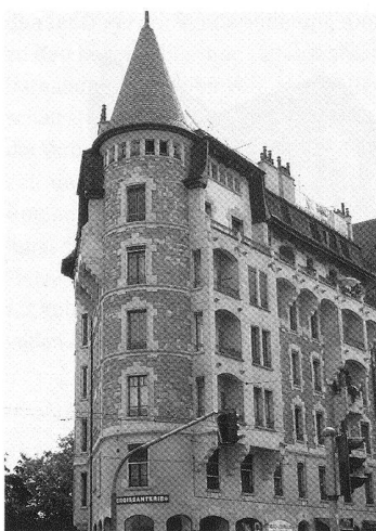
Genève, immeuble de logements, rue de Saint-Jean 56–58, angle chemin du Ravin, 1909 (© 2003 Mélanie Delaune, Genève)

Mélanie Delaune, «William Henssler, architecte (1875–1951)», mémoire de licence sous la direction de Leïla el-Wakil, Université de Genève, 2003. Adresse de l'auteur: 23, route du Moulin-Rouge, 1237 Avully