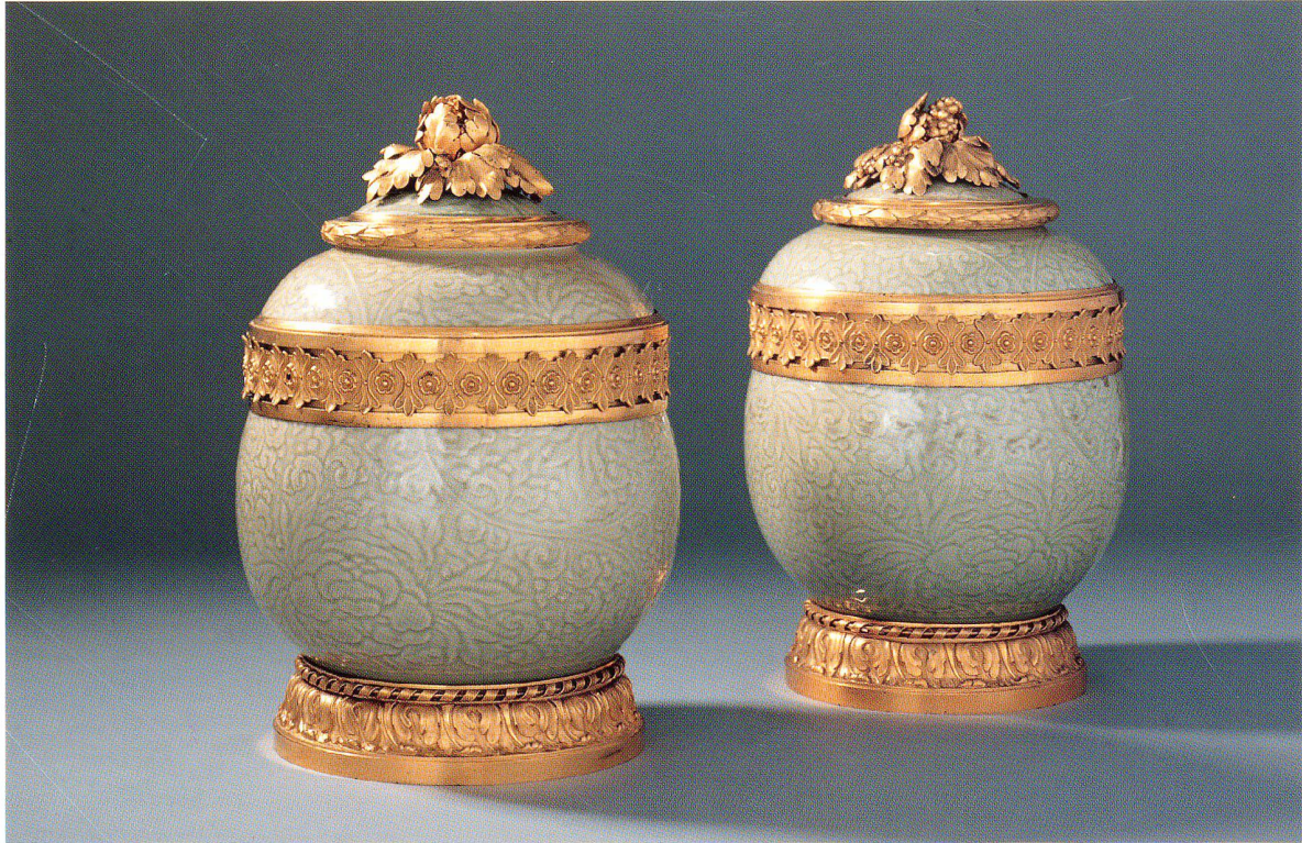
Ein Paar Vasen China, vermutlich Jingdezhen, späte Kangxi-Periode, frühes 18. Jahrhundert, Seladonporzellan, Bronze, vergoldet Fassung Wien oder Paris, um 1760, Höhe 33 cm, Sammlungen des Fürsten von und zu Liechtenstein, Vaduz

Die Kunst erfolgreicher Vermögensanlagen basiert auf dem perfekten Zusammenspiel zwischen Kunde und Vermögensverwalter.