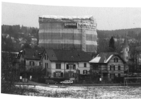
Gerettet dank der Hilfe des Heimatschutzes: Der Gasometer in Schlieren. Sauv  avec l'aide de Patrimoine suisse: le gazom tre de Schlieren.