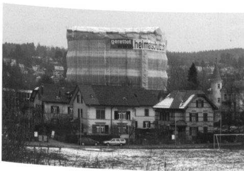
Gerettet dank der Hilfe des Heimatschutzes: Der Gasometer in Schlieren. Sauv  avec l'aide de Patrimoine suisse: le gazom tre de Schlieren.