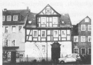
Ketzertuch 44, Zustand nach der Freilegung