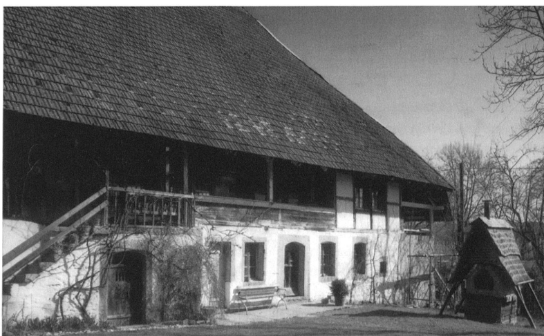
Dotzigen, Ansicht der Alten Mühle. (Heinz Dieter Finck)

Nähere Auskunft über die Pro Patria-Sammlung 2005 erteilt gerne: Schweizerische Stiftung Pro Patria, Clausiusstrasse 45, 8023 Zürich, Tel. 01 265 11 60, Fax 01 265 11 69, info@propatria.ch, www.propatria.ch. Roman G. Schönauer