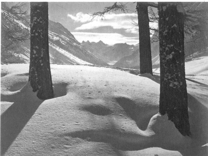
Albert Steiner, Winterlandschaft, undatiert. (Bündner Kunstmuseum Chur; © Bruno Bischofberger, Meilen)

bis 18. September 2005, Di–So, 10–17 Uhr, Do 10–20 Uhr. Bündner Kunstmuseum Chur, Postplatz, 7002 Chur, Tel. 081 257 28 68, www.buendner-kunstmuseum.ch