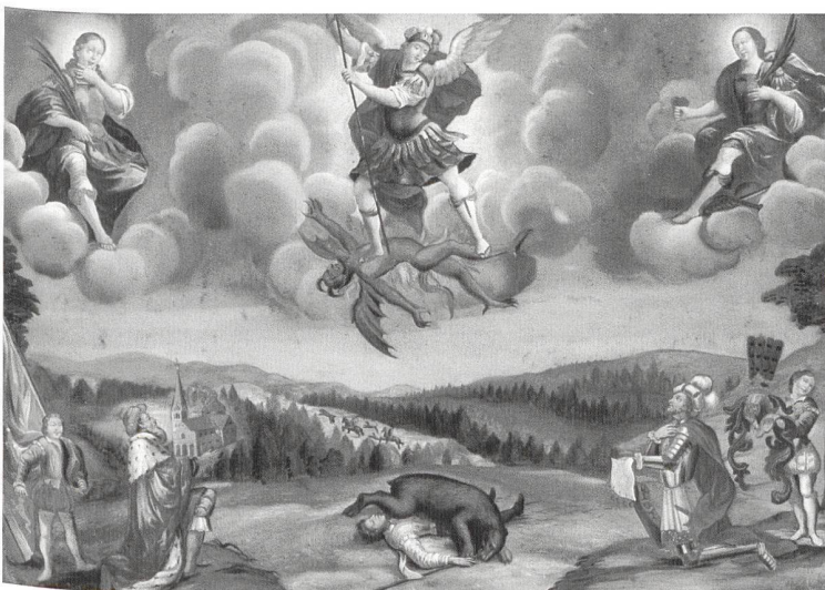
Cornel Suter d. Ä. (zugeschrieben), Die Gründungslegende von Beromünster, Hinterglasgemälde, um 1787, Haus zum Dolder, Sammlung Dr. Edmund Müller, Beromünster.

Die Ausstellung gliedert sich in zehn thematische Aspekte: «Lebenswelten», «Innovation», «Arbeit», «Luxus», «Massenkultur», «Geld und Gold», «Krisen und Konflikte», «Ladies first», «Ausstellung Schweiz» und «Heimat». Das Ziel dieser zum Teil unkonventionellen Gruppierungen von Objekten ist es, das Publikum zu überraschen und es einzuladen, gängige Sichtwei-