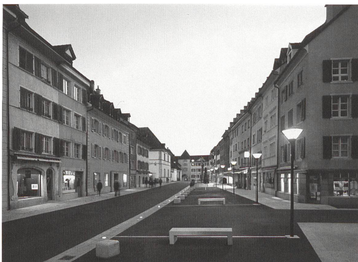
Delémont, Stadtzentrum.

Dank seiner klaren raumplanerischen Strategie konnte Delémont die Qualität der baulichen Entwicklung steigern. Mit der Verleihung des Wakkerpreises will der Schweizer Heimatschutz die Stadt auf dem eingeschlagenen Weg bestärken und anderen Gemeinden zeigen, dass kontinuierliches Engagement Früchte trägt. pd/rb