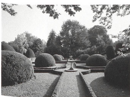
Baden, Garten der Villa Boveri.

Der Schulthess-Gartenpreis wird dieses Jahr bereits zum achten Mal vergeben. Ausgezeichnet werden herausragende Leistungen auf dem Gebiet der Gartenkultur. pd/rb