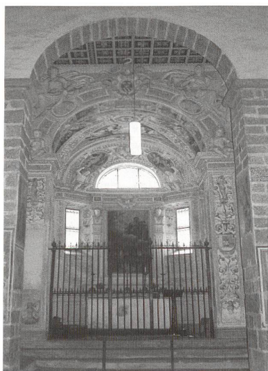
Biasca, Chiesa dei SS. Pietro e Paolo, Cappella Pellanda, veduta generale. (M. Foletti)