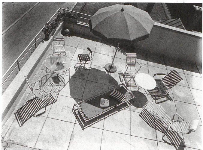
Hans Finsler, Wohnausstellung Neues Schloss, Stockerstrasse, Zürich (Wohnbedarf AG), 1934 (© Stiftung Moritzburg Halle/Saale)

bis 1. September 2006, Di–Do 10–20 Uhr Fr–So 10–17 Uhr, 1.8. geschlossen. Museum für Gestaltung Zürich, Ausstellungsstrasse 60, CH-8005 Zürich, Tel. 043 446 67 67, www.museum-gestaltung.ch