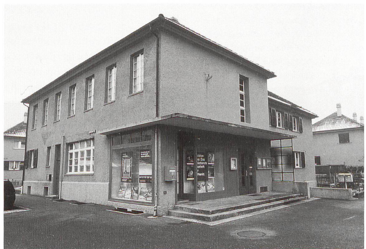
Nidau, Siedlung Hofmatten 1927, Genossenschaftsgebäude, Aufnahme 2004. (N. J. Ritter)