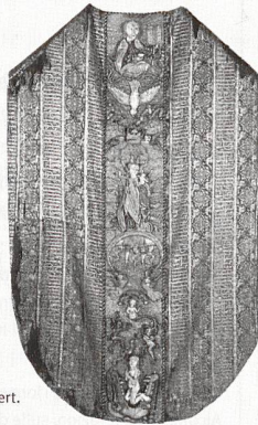
Kaseel. Islamisch-ägyptisches Seidengewebe, 14. Jahrhundert.

Neben bedeutenden Reliquiaren finden sich im Churer Domschatz auch zahlreiche liturgische Gewänder und textile Ausstattungsgegenstände für den kirchlichen Gebrauch. Die bedeutenden Kunstwerke gehören zur mittelalterlichen Ausstattung der Kathedrale Chur und der Kloster-Kirche St. Luzi.