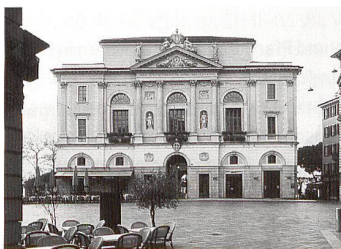
Lugano, Palazzo Civico.

Si veda il tagliando accluso alla fine della rivista