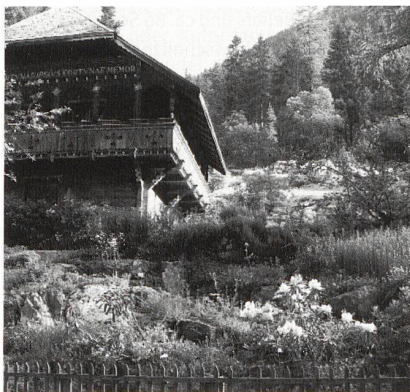
Champex VS, Alpengarten «Flore-Alpe».

Verschlungene Pfade führen über Brücken und vorbei an zahlreichen Felspartien, kleinen Bächen und Seen durch den Garten. Bänke laden zum verweilen ein und eröffnen einen wunderbaren Blick auf den Lac de Champex und die Bergwelt. Auf rund 6000 m 2 Felsen und anderen natürlichen Standorten wie Feuchtgebieten und Magerweiden werden mehr als 3000 Pflanzenarten aus den Alpen und anderen Gebirgen präsentiert. «Flore-Alpe» ist damit einer der reichhaltigsten Alpengärten der Alpen. Spezialsammlungen, zum Beispiel von Alpenrosen, Primeln oder Steinbrechen, erhöhen den botanischen Wert des Gartens. Ein besonderer Bereich ist den geschützten Pflanzen der Schweiz gewid-