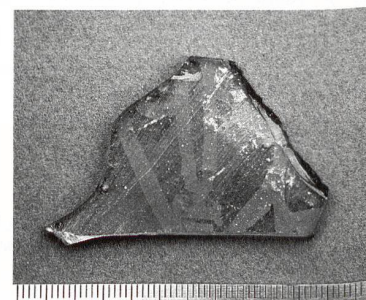
1 Frammenti di vetro da finestra alpino e una tessera, rinvenuti durante gli scavi della chiesa cimiteriale di Sous-le-Scex presso Sion, V-VI secolo.