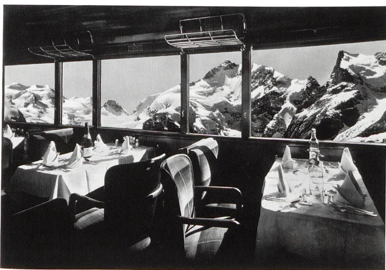
Blick ins Bernina-Massiv, Aufnahme um 1950.

bis 2. Dezember 2007, Di 10–21 Uhr, Mi–So 10–17 Uhr, 1. August geschlossen. Kunst- museum Bern, Hodlerstr. 8–12, 3000 Bern 7, Tel. 031 328 09 44, www.kunstmuseum.bern