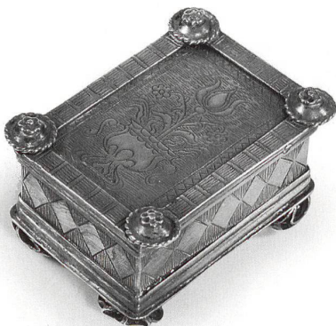
Besamimbüchse, Endingen, 18. Jahrhundert.

bis 31. Dezember 2008, Mo, Di 14–17 Uhr, So 11–17 Uhr. Jüdisches Museum Schweiz, Kornhausgasse 8, 4051 Basel, Tel. 061 261 95 14, www.juedisches-museum.ch