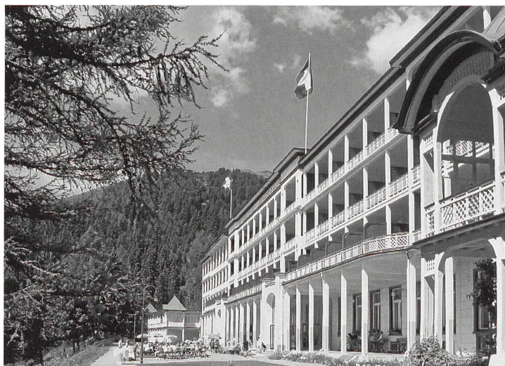
Davos, Hotel Schatzalp.

Mit «Besonderen Auszeichnungen» wurden zudem von der Jury geehrt: das Restaurant Safran Zunft in Basel «für die kontinuierliche Pflege des detailreich erhaltenen historischen Zunfthauses, das sorgfältig ergänzt wird und mit innovativen gastronomischen Ideen die lokalen Traditionen fortleben lässt»; das Dampfschiff Lötschberg auf dem Brienzensee «für den sorgfältigen Rückbau des Salondampfers nach denkmalpflegerischen Grundsätzen» sowie die Jugendherberge Zürich «für einen bewussten und gelungenen Umbau des Baus aus den 1960er-Jahren und für eine hervorragende Unternehmensphilosophie im Bereich des Sozialtourismus. Die Jugendherberge Zürich ist ein typisches Beispiel für den allgemein sorgfältigen Umgang mit Architektur und Design, wie ihn die Schweizer Jugendherbergen pflegen». Den Mobiliar-Spezialpreis erhielt das Gasthaus Rathauskeller in Zug. pd/rb