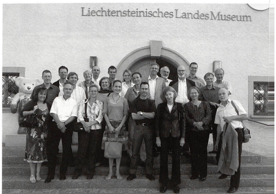
6 KdS-Autorentagung in Vaduz, 22./23.09.2006: Gruppenbild der Autorinnen und Autoren sowie Vertreterinnen und Vertretern der GSK. – Hauptthema war die Diskussion des Berichts der AG Zukunft KdS (genehmigt vom Vorstand am 27.04.2006).

Doch die kulturpolitische und finanzielle Basis wankt. Die festlich begangenen Buchvernissagen können nicht darüber hinwegtäuschen, dass sich die Akzeptanz des Werkes massiv verringert hat – obwohl das Interesse für Architektur (auch für die historische) so gross wie selten ist. Die von zunehmendem Mitgliederschwund betroffene GSK muss sich fragen, ob die KdS, der sie einst ihren Erfolg verdankte, inzwischen eine Hypothek darstelle. Der eins-