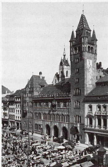
Abb. 264. Das Rathaus zu Basel am Marktplatz, 1932.