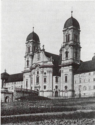
Abb. 1. Einsiedeln. Die Stiftskirche. Hauptfassade von Südwesten.