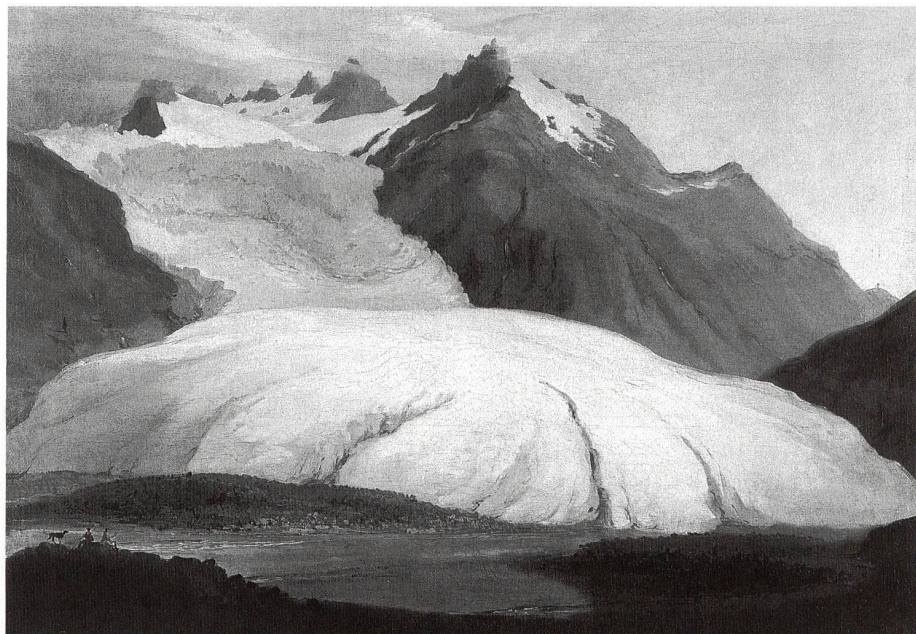
1 Caspar Wolf, Der Rhonegletscher von der Talsohle bei Gletsch gesehen, 1778, Öl auf Leinwand, 54 × 74 cm, Aargauer Kunsthaut Aarau. – Mittels des Gegensatzes zwischen der Kleinheit des Menschen und der Grösse der Berge wird das Gefühl des Erhabenen von Caspar Wolf «ins Bild gesetzt».