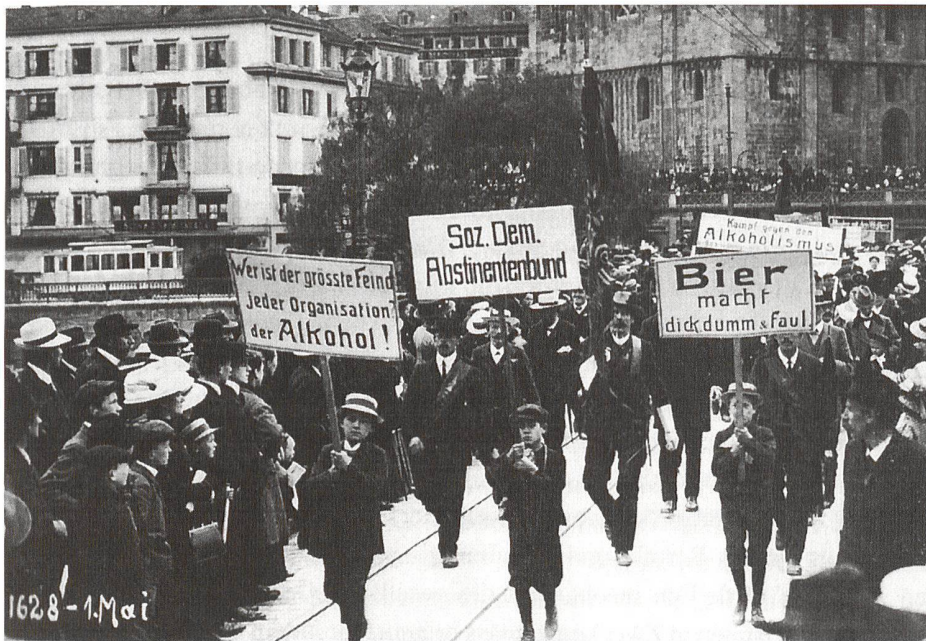
5 La ligue social-démocrate pour l'abstinence a une place fixe dans le cortège du 1 er mai. Ici en 1912 sur le Münsterbrücke à Zurich.