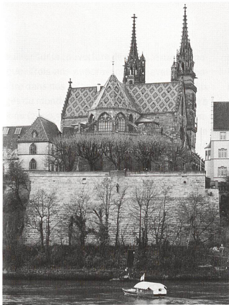
Basler Münster. (Erik Schmidt)