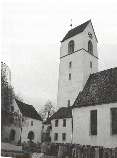
Herznach, Pfarrkirche St. Nikolaus. (L. Hüsser)