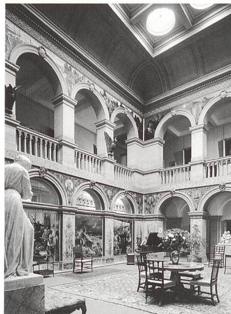
Wallington Hall, zentrale Halle.

Leistungen: Linienflug Zürich–Manchester retour, bequemer Bus; qualifizierte GSK-Studienreiseleiterin; alle Eintritte und Führungen