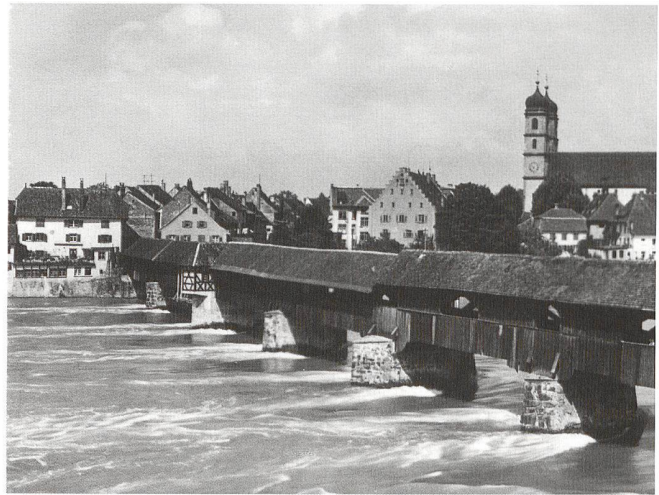
Bad Säckingen, Blick vom Schweizer Ufer auf Holzbrücke und Stadt. (Postkarte)

Sie erhalten keine Bestätigung, aber eine Absage, falls die Führung ausgebucht sein sollte.