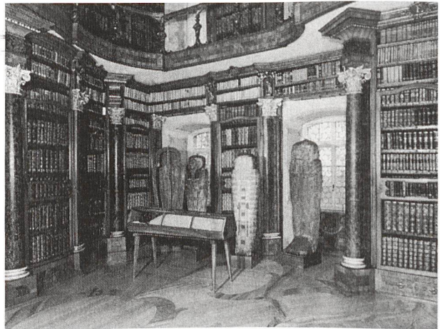
St. Gallen, ehemalige Benediktinerabtei, Stiftsbibliothek.

Informationen zu weiteren Führungen: www.visitbasel.ch