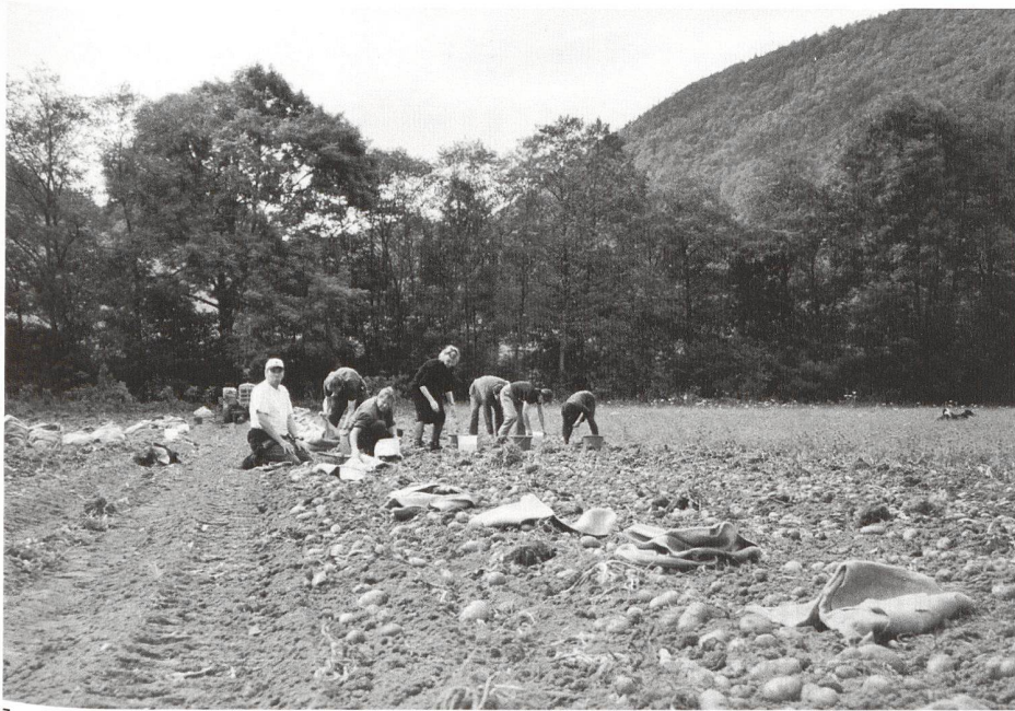
6 Le Montois, Bau des Turbinenhauses.