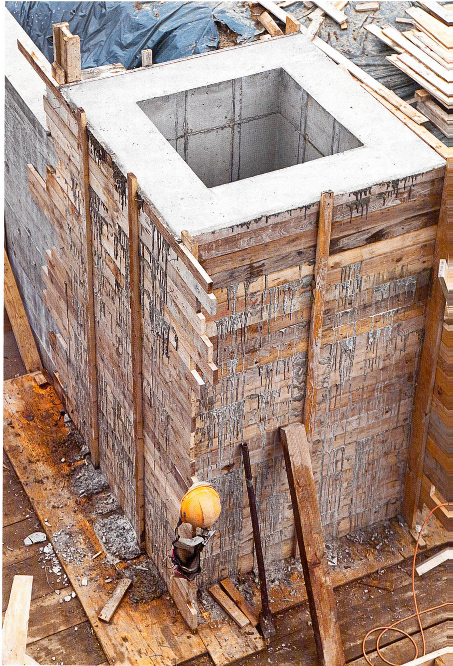
Betonwerk: Im Inneren schlummert das cartesianische Netzwerk der Armierung

Hier liegt die Quelle eines Konsenses, den Ingenieure zur äusseren Formfindung von Tragwerken, wie zum Beispiel bei Brücken oder Tunnelgewölben, vortragen, wenn sie die komplexe Logik des Kräfteflusses als «Motor für die Form» darstellen. Tatsächlich entwickelt sich die Form jedoch viel öfter zum Beispiel nach dem massgebenden kritischen Querschnitt eines statischen Bauteils und nach der ökonomisch einfachsten Verfügbarkeit des Schalungsmaterials. Dieses ist mittlerweile vom «verlorenen» zum «wiederverwendbaren» mutiert und prägt dem Bauprozess einen geordneten Ablauf (Schalungsetappen) und dem Bauwerk die Spuren der Modularität von Schaltafeln und Grossflächenschalungen in Stahlblech auf. Der Kräftefluss wird jedoch entsprechend der auftretenden Kräftekonzentrationen durch Verdichtung und Verteilung der Armierung tief im Beton drin organisiert, was sich höchst selten in der äusseren Form ausprägt. ▶