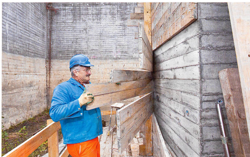
HSG St. Gallen: Betonrestaurierung am Hauptbau von Walter Maria Förderer

erhärtete Betonbrei nichts mit Holz zu tun hat und alles andere als ephemer ist. Ein glatter Widerspruch zur plastisch-kubischen Form eines «Beton-Räumlings», der überdies wie aus Stein gegossen scheint?