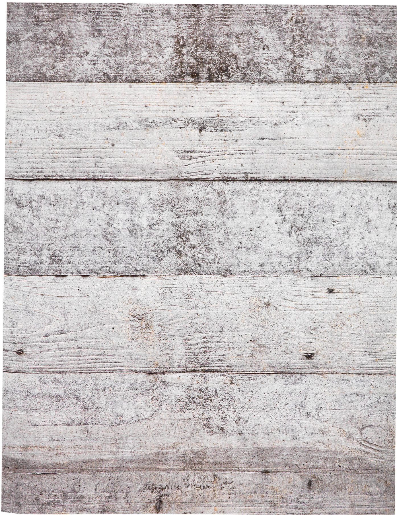
Schalungsbild: Alles, was am Sichtbeton noch feststellbar ist, sind «Fingerabdrücke» des Holzes