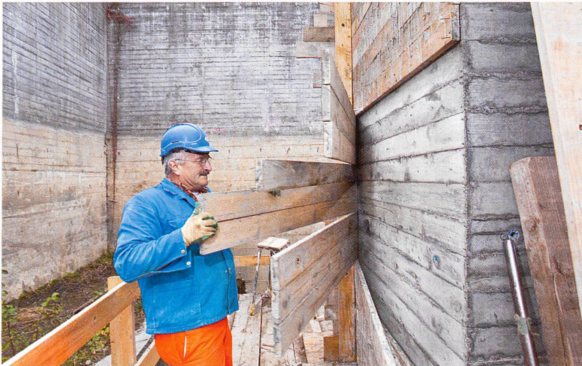
HSG St. Gallen: Betonrestaurierung am Hauptbau von Walter Maria Förderer

erhärtete Betonbrei nichts mit Holz zu tun hat und alles andere als ephemer ist. Ein glatter Widerspruch zur plastisch-kubischen Form eines «Beton-Räumlings», der überdies wie aus Stein gegossen scheint?