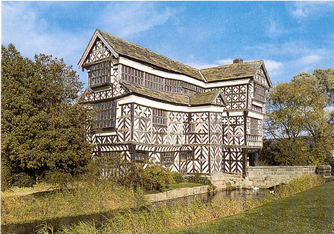
Das Fachwerkhaus Little Moreton Hall

Malerische Gärten und prächtige Landsitze in den Grafschaften Cheshire und Yorkshire