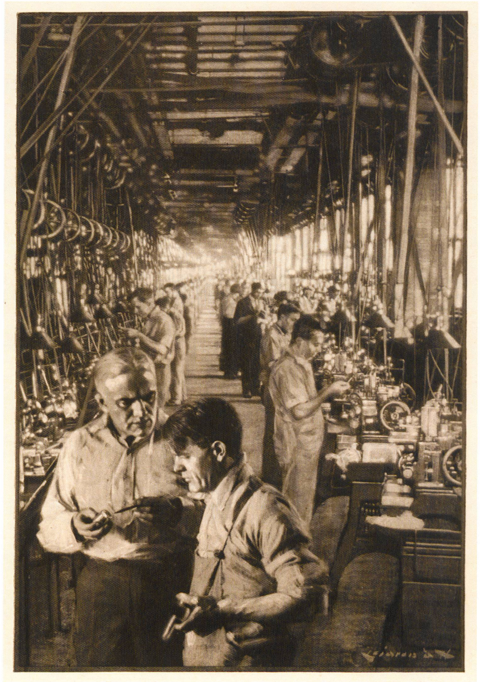
«A Glimpse of a Giant Industry»: Um 1920 produzierte die US-amerikanische Firma Ingersoll 20 000 Uhren pro Tag