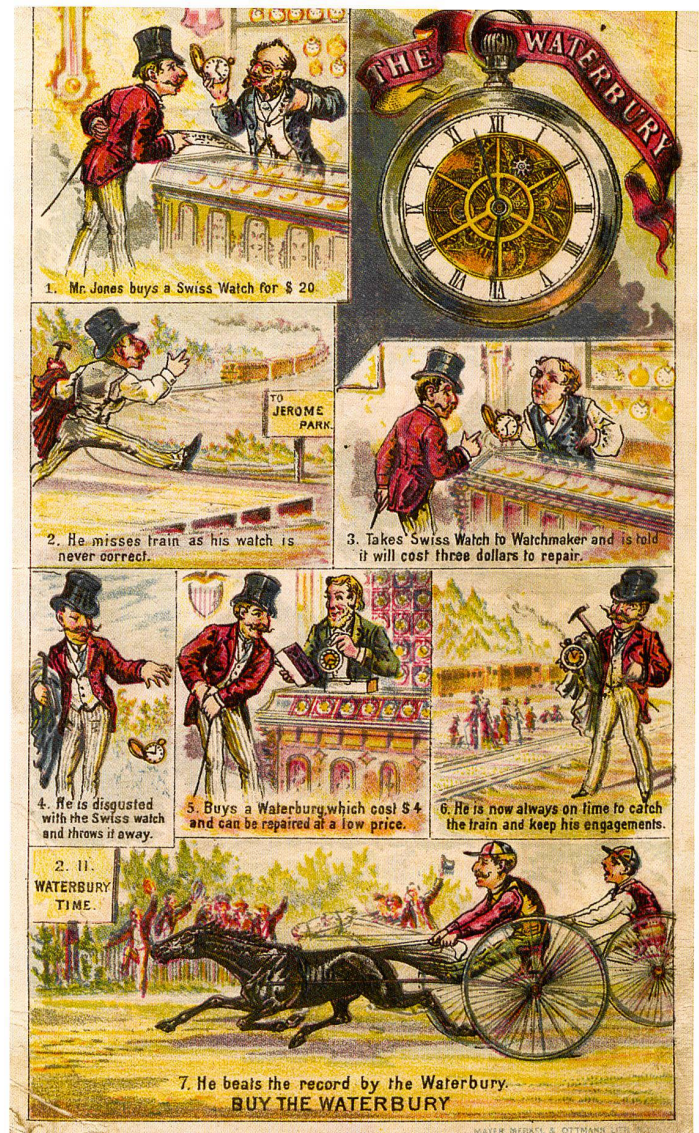
Mr. Jones buys a Swiss Watch ... Werbekarte der Firma Waterbury Watch Co. Waterbury (USA), um 1882

In den 1870er Jahren jedoch ging es dramatisch bergab. Konnten 1872 noch 366 000 Uhren in die USA geliefert werden, waren es 1875 noch 70 000. Der Grund dazu wurde an der Weltausstellung 1876 in Philadelphia sichtbar. Dort stellte die American Watch Co. ihre Produktion nach dem «American System» vor: Einsatz von Maschinen und maximale Arbeitsteilung unter einem Dach. Dies sparte Kosten und stellte zudem eine gleichmässige Qualität sicher. Hier lag die Schwachstelle der Schweizer Uhren, da diese unter Einsatz von viel Heimarbeit gefertigt wurden. So lesen wir 1882 auf einer Werbekarte der Firma Waterbury Watch Company: