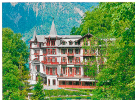
Giessbach → 58