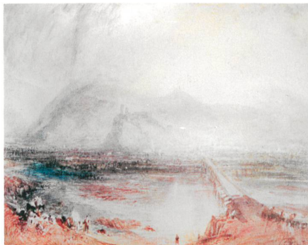
Turner → 52