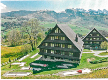
Wildhaus → 4