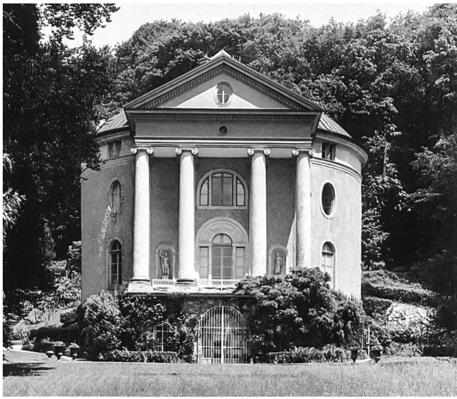
Perroy, La Gordanne, villa néopalladienne élevée vers 1803 selon un modèle anglais, faisant lui-même référence au Panthéon de Rome

château de Vincy qui appartient à la riche typologie des édifices entre cour et jardin.