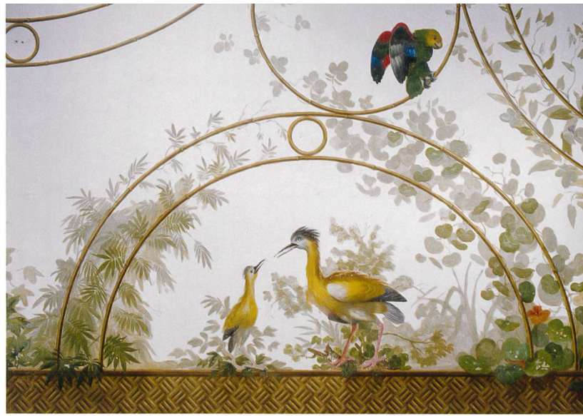
Dully, château. Niveau supérieur, salon ou salle à manger «volière». Détail du plafond peint

Il n'est donc pas surprenant qu'un tel pays de cocagne ait été parsemé d'imposantes demeures des XVI e , XVII e et XVIII e siècles, comprenant pressoirs, caves, logement du vigneron et résidence des maîtres. Le premier tiers du XIX e siècle a même suscité des palais comme l'extraordinaire villa cylindrique de La Gordanne, réduction du Panthéon de Rome à travers un modèle anglais, ou diverses villas néoclassiques (voire néogothiques pour les dépendances), inspirées de modèles internationaux. Combinant l'utile et l'agréable, ce patrimoine présente des éléments marquants non seulement dans les secteurs de l'architecture ou de l'art des jardins, mais aussi de l'ornementation gothique flamboyante, des panneaux sculptés Renaissance, des papiers peints de la fin du XVIII e siècle et autres décors peints ou sculptés laissés par des artistes de grande qualité. ●