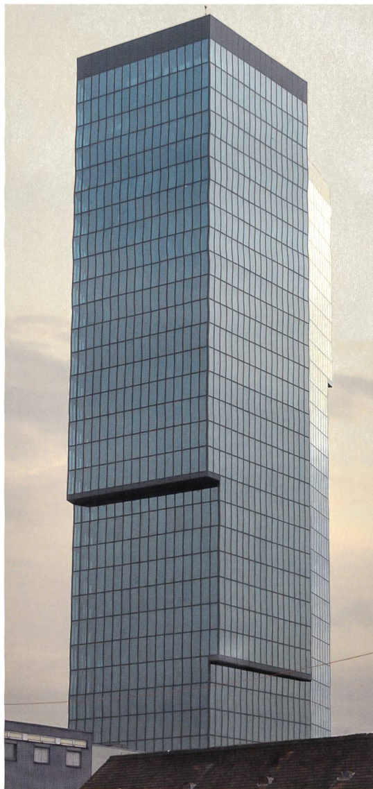
Prime Tower: Die Stahl-Glas-Fassade wirkt abstrakt, distanziert, präzise und strebt eine volumetrische Gesamtwirkung an, die sich je nach Lichtverhältnissen verändert. Architekten Gigon Guyer.

mit der werkseitigen Mischung weitgehend eliminiert, Herstellungsspuren beim Perfektionieren der Oberfläche homogenisiert; die Lebendigkeit kann dabei verloren gehen. Gleichzeitig wird durch die Oberflächenbearbeitung das heterogene Innere freigelegt und der Blick «in die ►