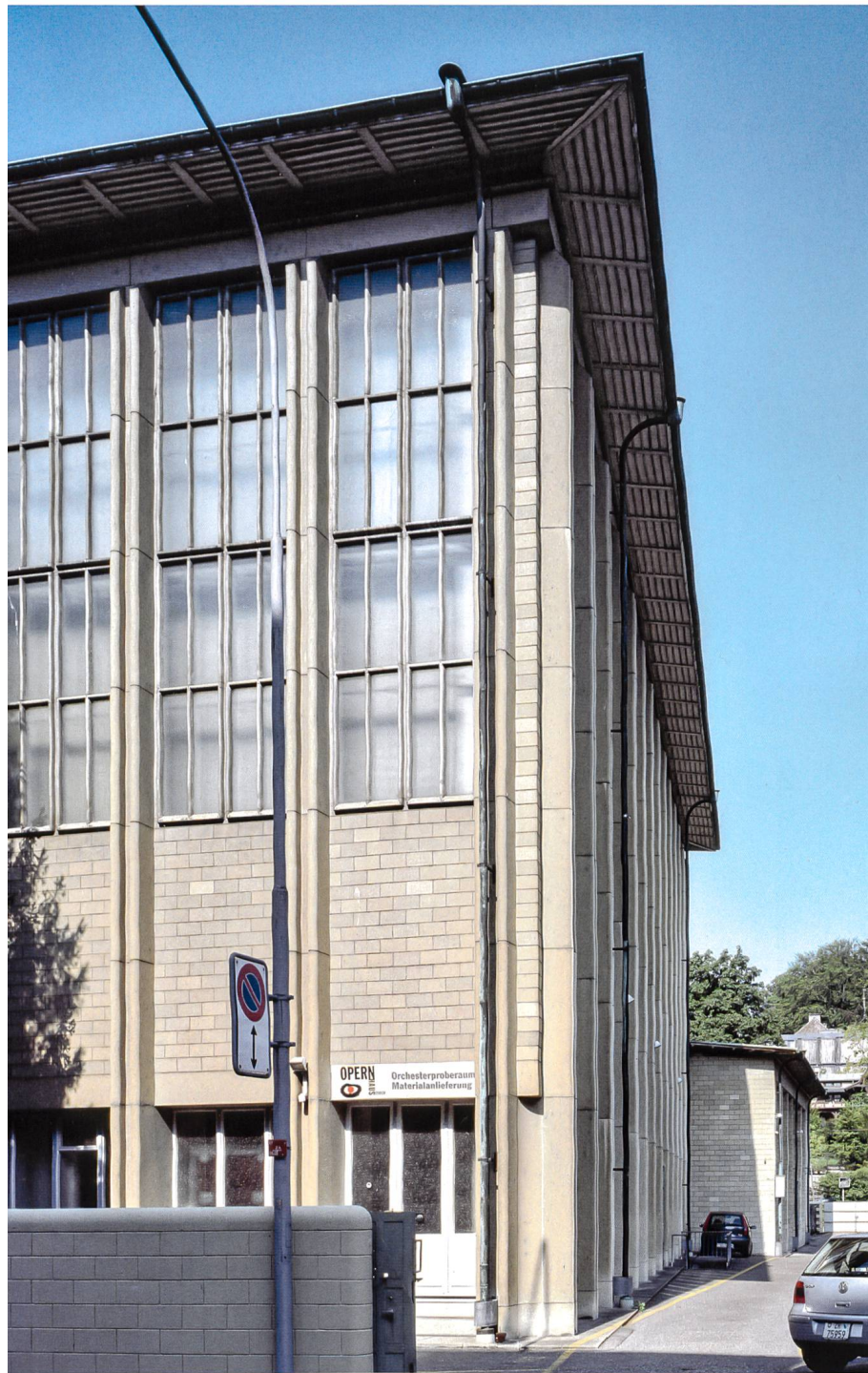
First Church of Christ Scientist in Zürich: Der variantenreiche Einsatz von Kunststein ermöglicht ein komplexes Zusammenspiel von Materialität, Tektonik und Plastizität. Architekten Kellermüller & Hofmann.