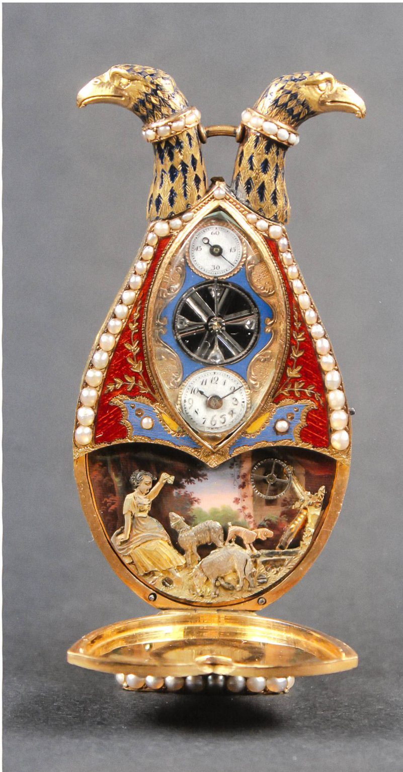
Pendulette lyre avec automate à musique. Pignet & Capt, entre 1795 et 1800, Genève. Or, émail, perles. H 72 mm, L 33 mm, E 13 mm.

On raconte ainsi la naissance de la vocation chez Jacques de Vaucanson que sa mère emmenait en visite tous les dimanches. L'enfant ►